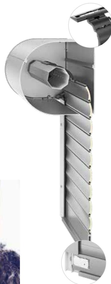
Mechanizm zapadkowy z rozwiązania Aluprof Safety Plus